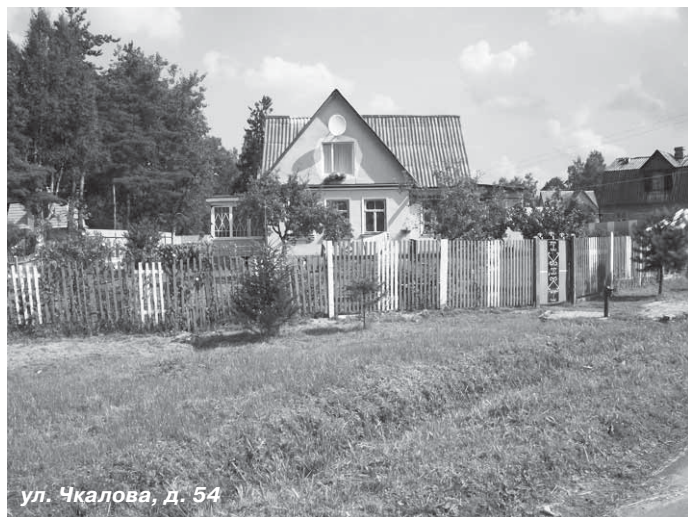
ул. Чкалова, д. 54

А вот если кому-то вздумалось нарубить веток для костра или даже спилить целое дерево – неважно, из хулиганских побуждений или для каких-то личных целей, – не торопитесь. Помните: повреждение или уничтожение зеленых насаждений без порубочного билета влечет за собой наложение административного штрафа в размере от 3000 до 5000 рублей (об этом говорится в статье 9 вышеупомянутого закона).