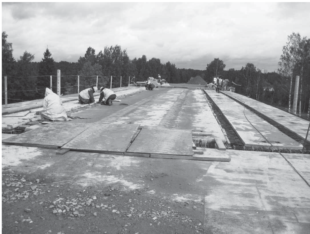
29.08.2011 года в 20.00 завершили укладку несущих балок нового путепровода на Горском шоссе