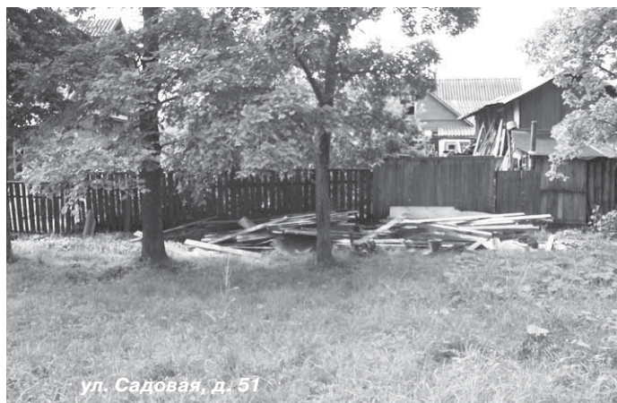
ул. Садовая, д. 51