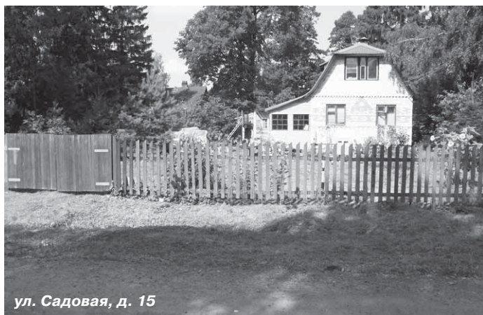
ул. Садовая, д. 15

Привычка вешать на столбах или заборах объявления или таблички с предложением товаров и услуг тоже может обернуться неприятностями: по статье 18 за нарушение правил распространения наружной рекламы и информации может быть наложен административный штраф в размере от 500 до 500 рублей.